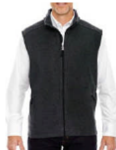
VESTE POLAR POUR HOMME