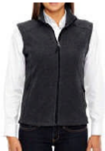
VESTE POLAR POUR FEMME

Tableau des tailles pour la veste polar offerte à chaque participant(e) inscrit(e) au congrès 2015, gracieuseté de la FNCSF.